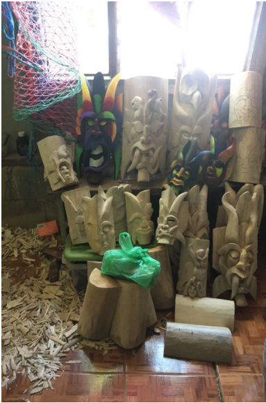
Figura 9. Producción de diferentes tamaños y formas de máscaras en casa de doña Casilda.