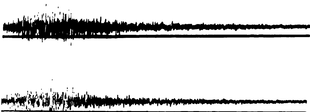
Fig. 1. Reproducción fotográfica reducida a 1/2,4 de los registros completos. Acelerograma superior S80°W (escala vertical 0,55 cm: 0,1 g). Acelerograma inferior N10°W (escala vertical 0,53 cm: 0,1 g). La línea de puntos da la escala de tiempos, a razón de 2 puntos por segundo.