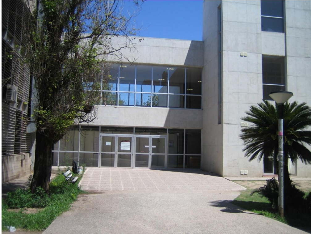
Fig. 5 Acceso a edificio de la Facultad de Ciencias Económicas. Ciudad Universitaria. Universidad Nacional de Córdoba.