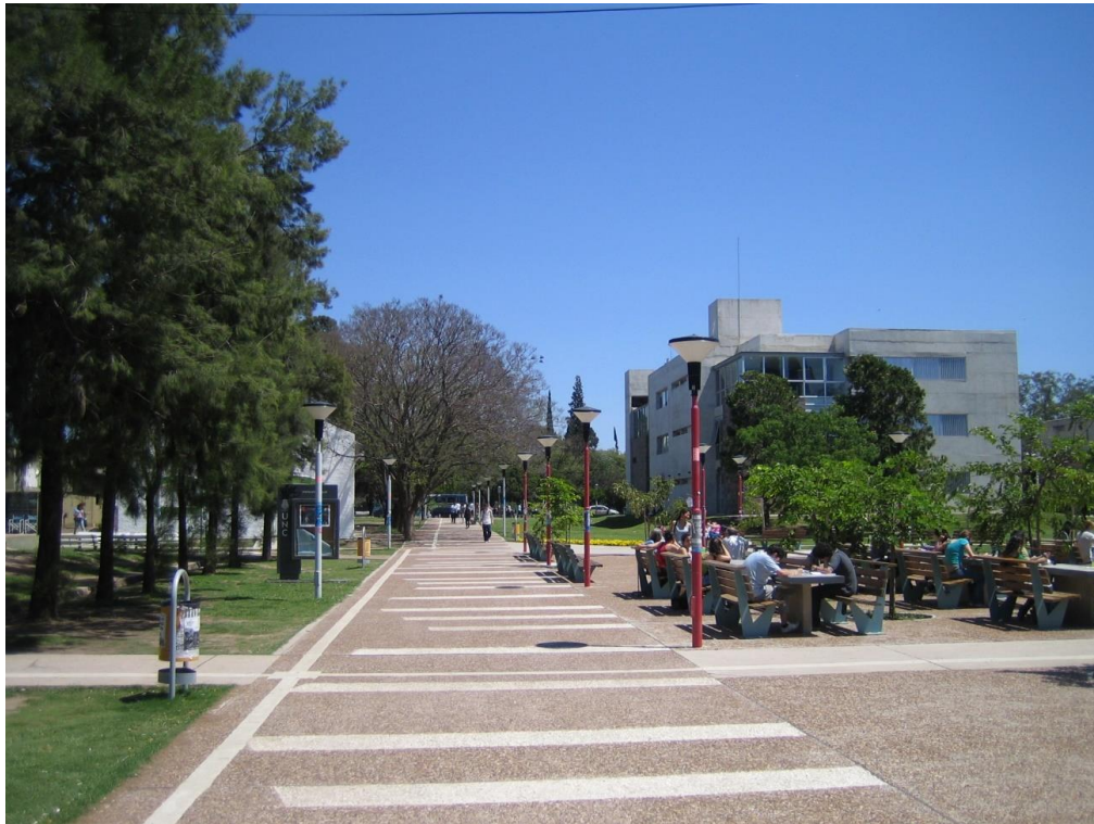
Fig. 3 Itinerario peatonal y mobiliario urbano en Ciudad Universitaria. Universidad Nacional de Córdoba.