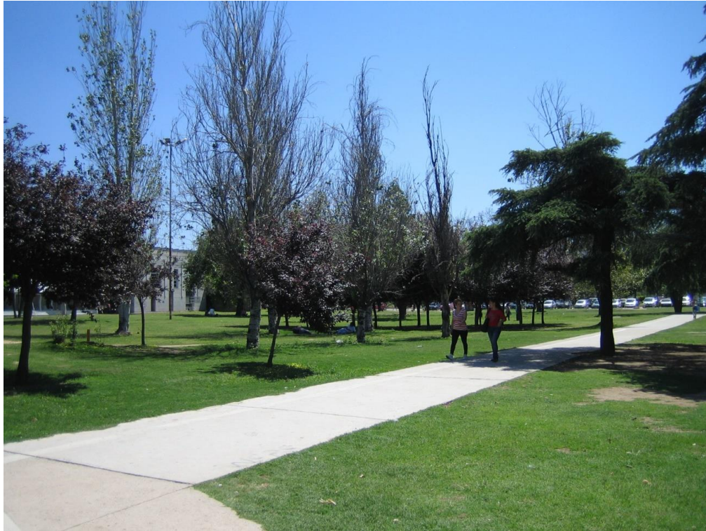
Fig. 1 Itinerario peatonal en Ciudad Universitaria. Universidad Nacional de Córdoba.