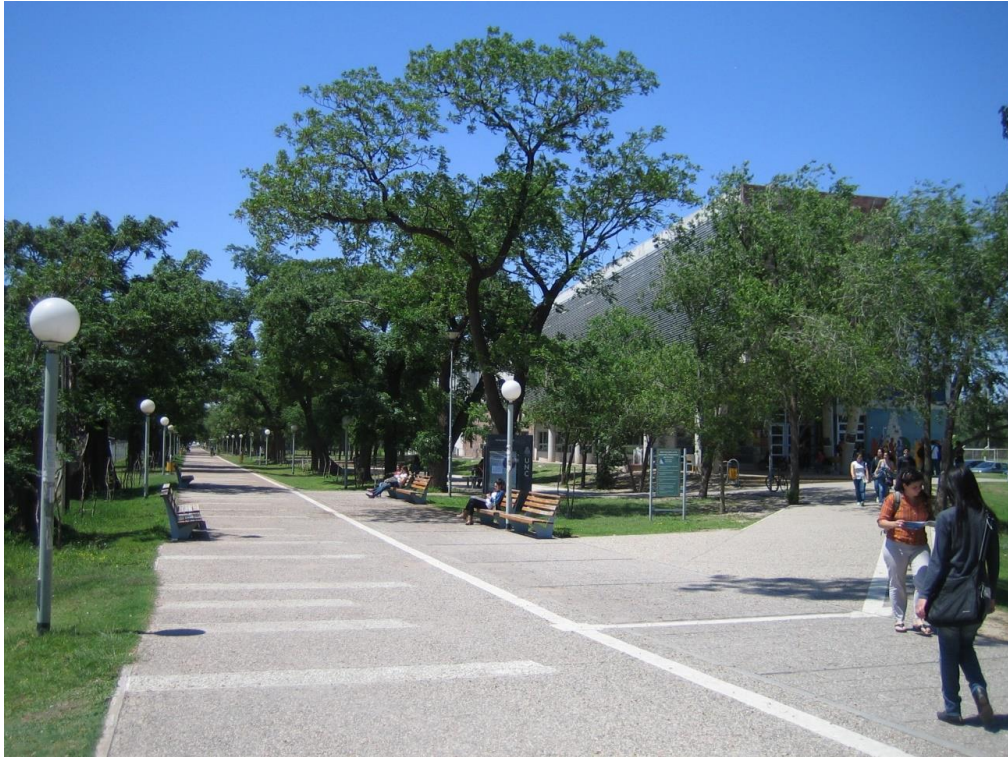
Fig. 2 Itinerario peatonal y mobiliario urbano en Ciudad Universitaria. Universidad Nacional de Córdoba.